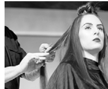
AVALON MID TOWN NEW TALENTS